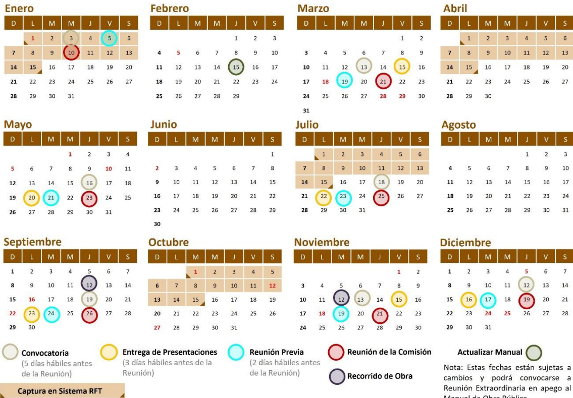
Anexo 1 - Calendario de Comisiones